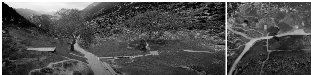
Εικόνα 6, 7 Οικισμός Κιάφας, κεντρικό σημείο.

Αντίστοιχα προτείνεται η ανάδειξη και των άλλων οικισμών του Σουλίου , όπως για παράδειγμα η Κιάφα . Από το κεντρικό σημείο των πηγαδιών και των δύο αιωνόβιων δένδρων ξεκινούν διαδρομές που συνδέουν με τοπόσημα και σημεία ενδιαφέροντος, ενώ προσφέρουν εξαιρετικές οπτικές φυγές προς το υπόλοιπο Τετραχώρι. Το σημαντικότερο γεγονός στο τοπίο είναι η άνοδος προς το Κάστρο της Κιάφας, που δεσπόζει στην περιοχή μεταφορικά και κυριολεκτικά. Στην πορεία προς το κάστρο, η ιστορική οικία Ζέρβα προτείνεται να αποκατασταθεί κατά προτεραιότητα ώστε να στεγάσει το μουσείο της ιστορίας των οχυρώσεων της περιοχής, ως αναφορά στην ιδιαιτερότητα του χώρου σαν τόπος οχύρωσης των Σουλιωτών κάθε φορά που δέχονταν επίθεση, κατά την διάρκεια των πολεμικών συγκρούσεων. Η επίσκεψη στο μουσείο (πιθανά ψηφιακό) και η άνοδος στο Κάστρο της Κιάφας, θα προσφέρουν μια ολοκληρωμένη εμπειρία ιστορικής περιήγησης και επαναφοράς της μνήμης στο χώρο.