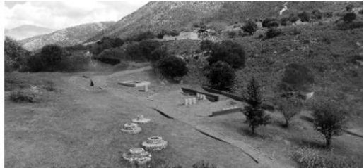
Εικόνες 2,3 «Κέντρο Σουλίου», τα πηγάδια, η λίμνη και το Πάρκο Ανεξαρτησίας.

Η περιοχή των πηγαδιών, όπως έχει ήδη αναφερθεί, είναι ο «πρωταγωνιστής» και το κεντρικό σημείο αναφοράς του χώρου. Η προχωρημένη φθορά και ο κίνδυνος εξαφάνισης των μοναδικών αυτών μνημείων τα καθιστά πρώτης προτεραιότητας για την μελλοντική επέμβαση. Προτείνεται παράλληλα να «αποκαλυφθεί» και να αποκατασταθεί η λεγόμενη «λίμνη», ώστε να ερμηνευθεί και να αναδειχθεί ολόκληρο το σύστημα λειτουργίας των πηγαδιών. Στην συνέχεια, η βασική διαδρομή φτάνει στην οικία Μπούση, πρόσφατα αποκατεστημένη από το ΥΠΠΟΑ για να λειτουργήσει ως μουσειακός χώρος (πιθανά μουσείο ιστορίας/λαογραφίας). Από την Οικία Μπούση η κεντρική διαδρομή οδηγεί τους επισκέπτες στην Οικία Μπότσαρη, και από εκεί στην οικία Δαγκλή, σημαντικό τοπόσημα με ιστορική και αρχιτεκτονική αξία, για τα οποία προτείνεται σε επόμενο στάδιο η αποκατάσταση και λειτουργία ως χώροι πολιτιστικής χρήσης.