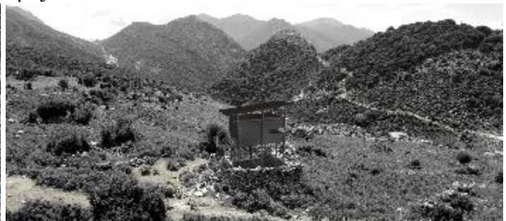
Εικόνα 4,5 Νότιες Κούλιες, το παρατηρητήριο.

Σε μια πορεία κατάβασης προς τα δυτικά και τα νοτιοδυτικά και αφού διασχίσει κανείς την περιοχή πυκνής κατοίκησης, οδηγείται σε μια περιοχή με επιβλητικούς βραχώδεις σχηματισμούς, που πιθανόν αποτέλεσαν πεδίο μαχών των αμυνόμενων Σουλιωτών. Από εκεί